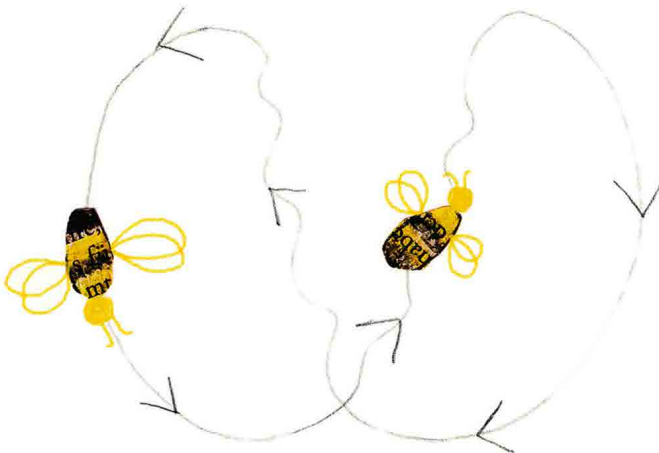
Beginnender Schwänzeltanz Başlayan kuyruk dansı