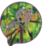
Totenkopff- äffchen Squirrel monkey