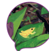
Raketenfrosch Rocket frog