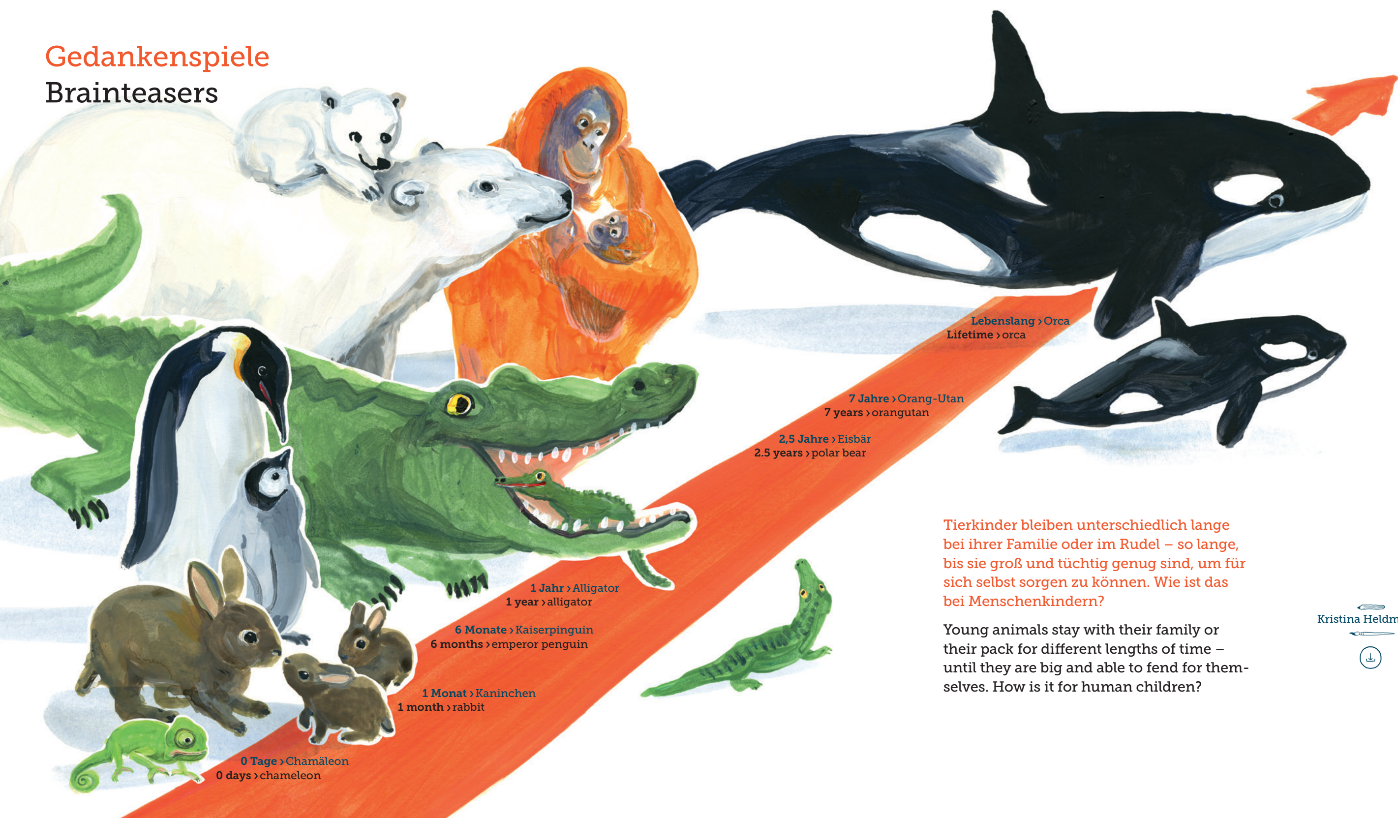
0 Tage › Chamäleon 0 days › chameleon