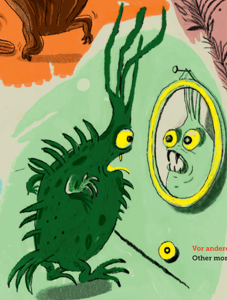
Vor anderen Monstern Other monsters