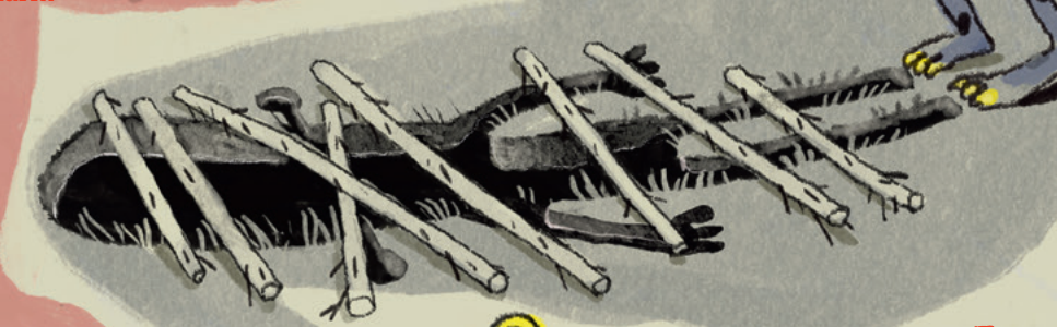
Vor Monsterfallen Monster traps