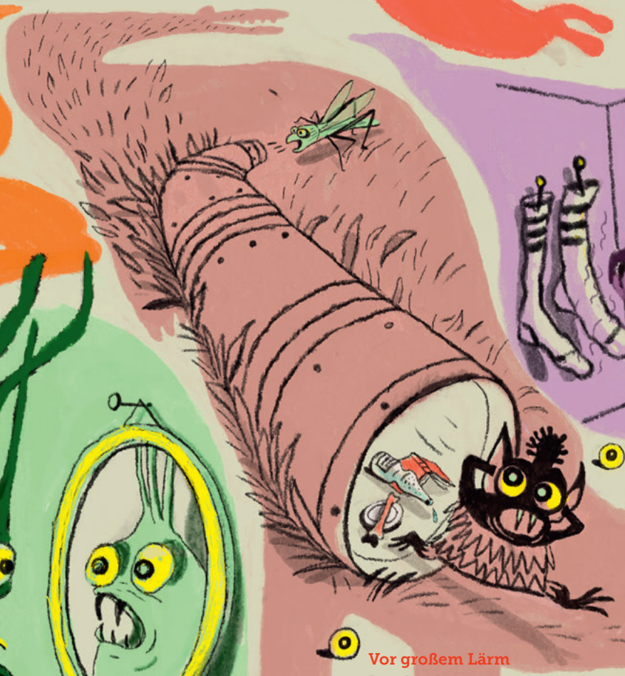
Vor großem Lärm Loud noises