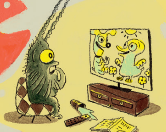
Vor fröhlichem Lachen Joyful laughter