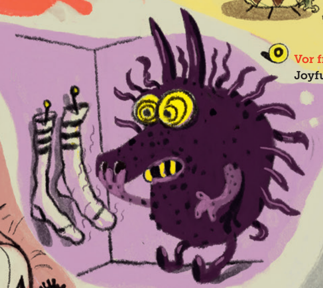
Vor ekeligen Gerüchen Disgusting smells