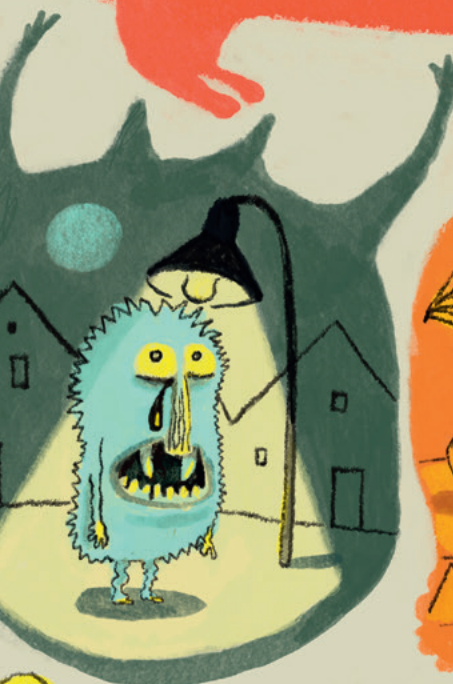
Vor grellem Licht Bright light

What do you think monsters might be afraid of?