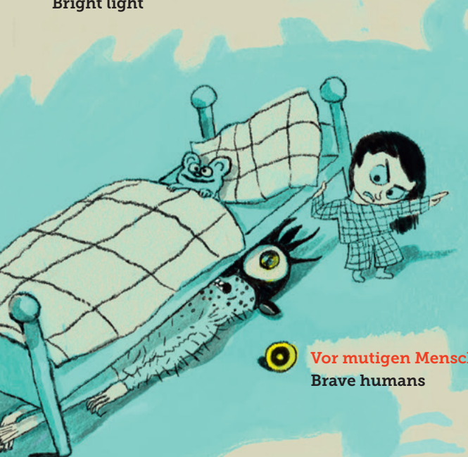
Vor mutigen Menschen Brave humans